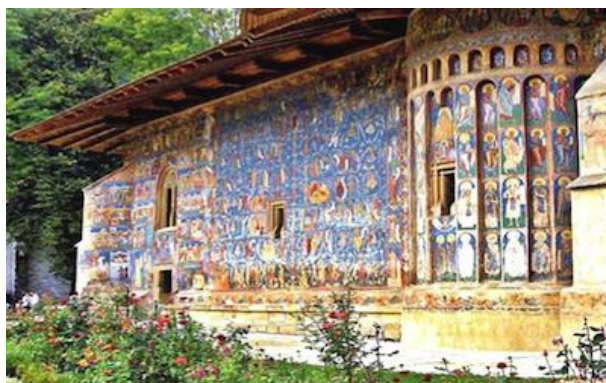
Monasteri della Bucovina