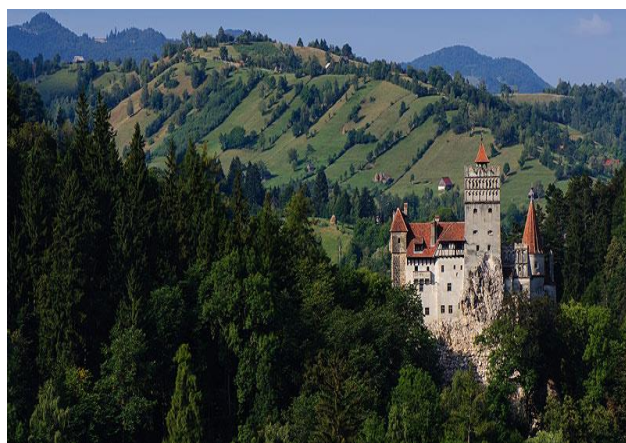
Castello di Bran